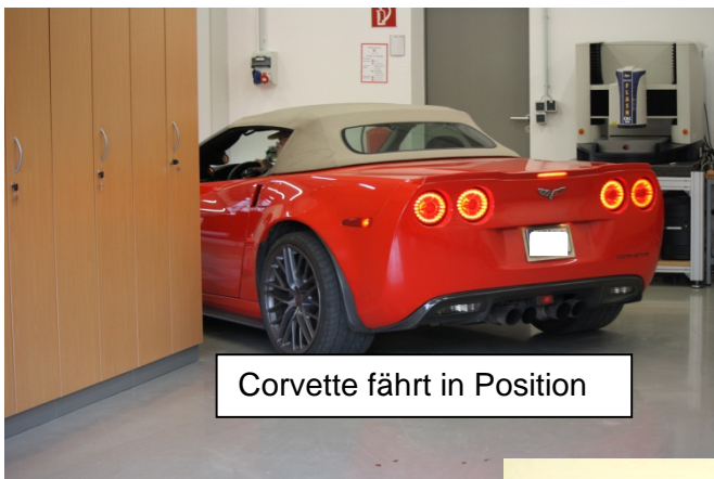
Corvette fährt in Position