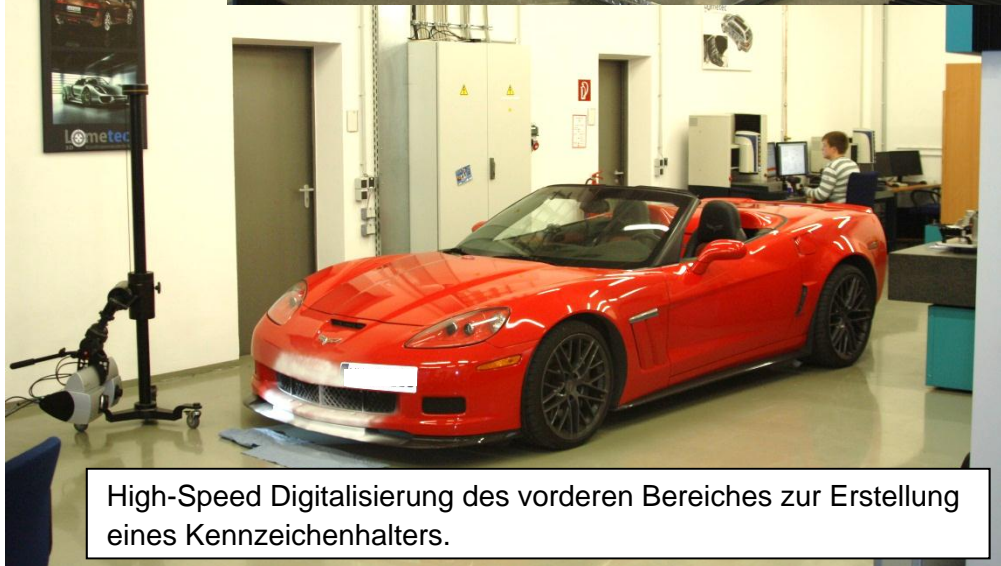
High-Speed Digitalisierung des vorderen Bereiches zur Erstellung eines Kennzeichenhalters.