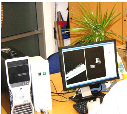
Datenaufbereitung. 3D-CAD Daten im STL-Format