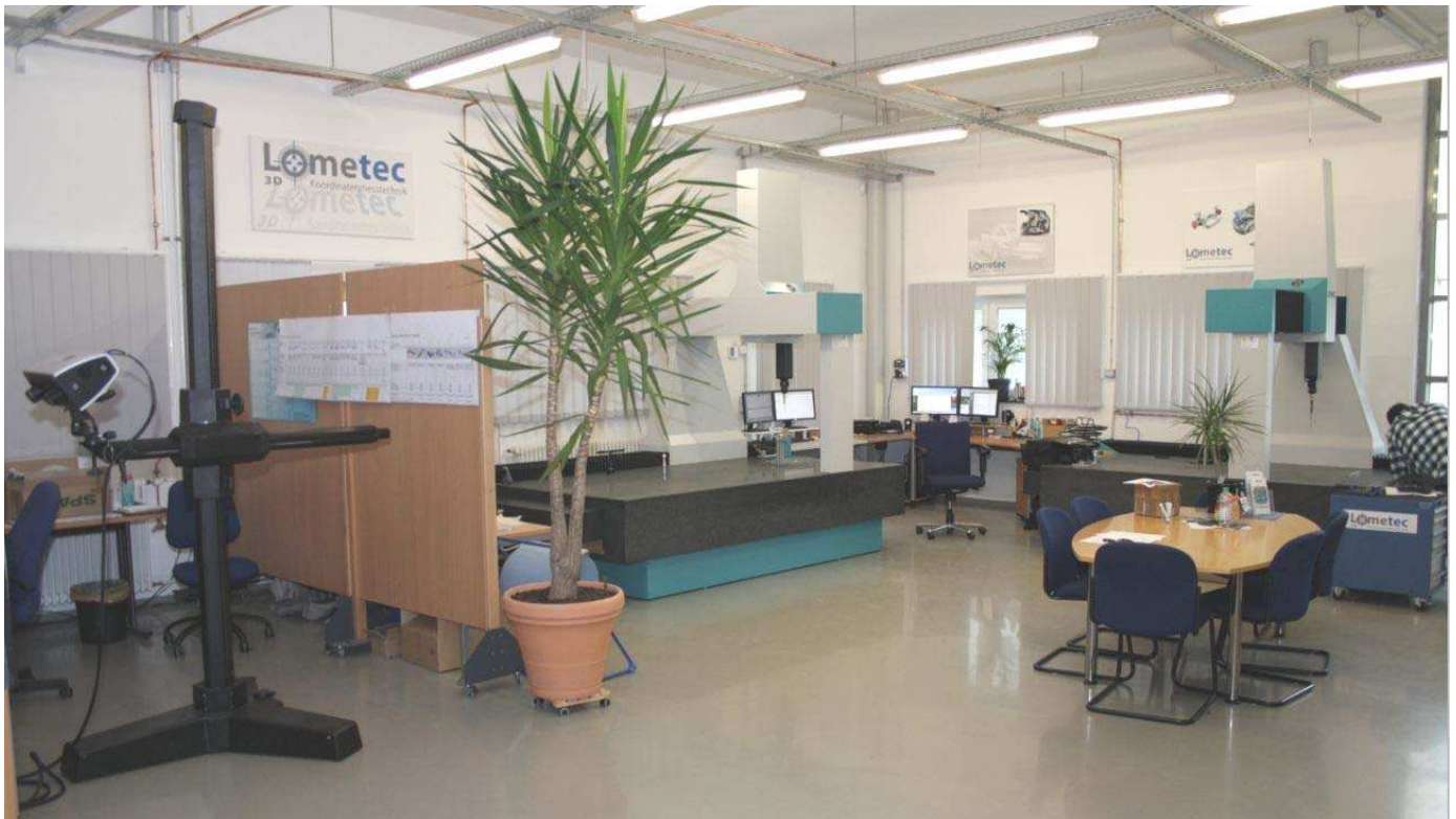
Blick in den neuen Messraum

Lometec investierte, in der jetzt rd. 210qm großen Halle, in neue Messanlagen. Somit stehen den Kunden, neben den beiden optisch videobasierten Messanlagen, eine weitere 2te taktile 3D-Koordinaten-Messmaschine zur Verfügung.