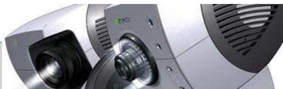
HighSpeed Digitaisiersystem im Einsatz

Mittels Streifenlichtprojektionsverfahren können die Kamener Messtechniker technische Bauteile unterschiedlicher Materialien zerstörungsfrei prüfen und dem Kunden so reproduzierbare Daten zur Teilegeometrie an die Hand geben.