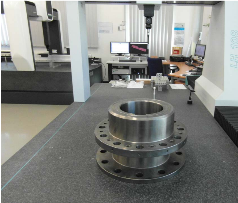
Antriebselement aus dem Maschinenbau